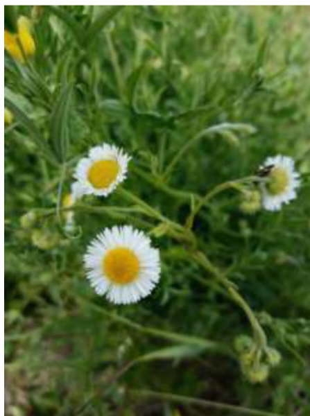
Рисунок 3. Мелколепестник щетинистый ( Erigeron strigosus Muhl. ex Willd.)

На рис. 3 фотография мелколепестника щетинистого ( Erigeron strigosus Muhl. ex Willd.) Т.А. Коптяевой, размещенная на платформе iNaturalist. Всего Т. А. Коптяевой на этой платформе размещено более тысячи наблюдений. Этот американский вид в Инсарском районе зарегистрирован впервые.