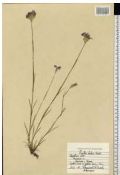
Рисунок 2. Гербарные образцы с территории Инсарского района в Гербарии МГУ им. М. В. Ломоносова (MW)